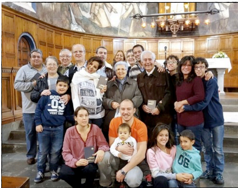
Lliurament Pva als SSCC del Centre de Sabadell, a la missa parròquial del dia 22 de novembre