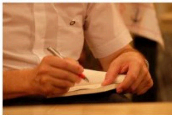
Ángel Fernández Artime, X Sucesor de Don Bosco